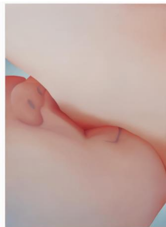
Ina III (2019) Vivian Greven