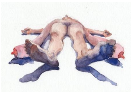
Tired breastfeeding boobs (2017) Jill Lavetsky